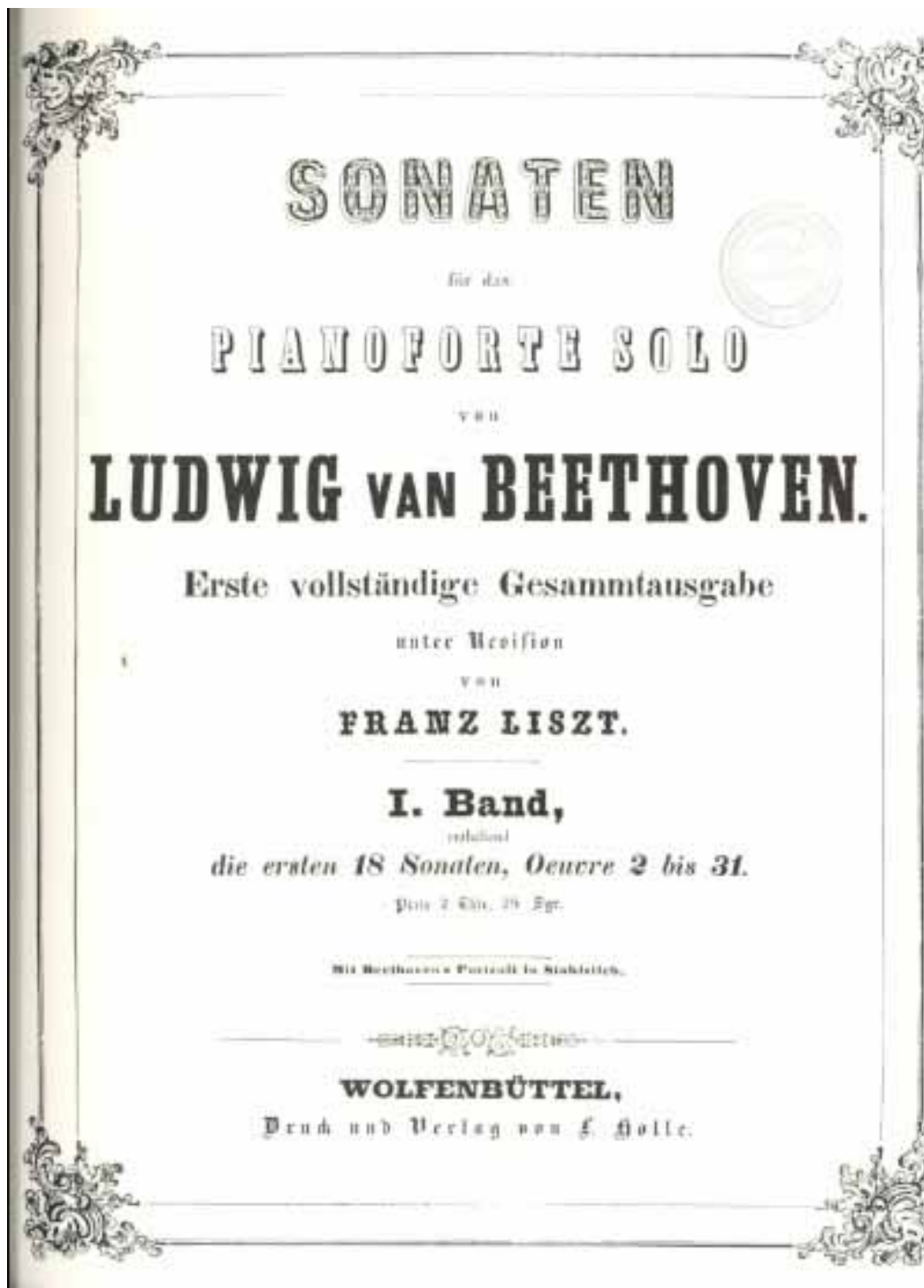
L. Van Beethoven, Sonaten für das Pianoforte , édition révisée par Franz Liszt, page de titre du 1er volume