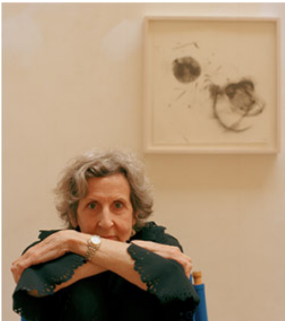
T. Brown © Lourdes Delgado