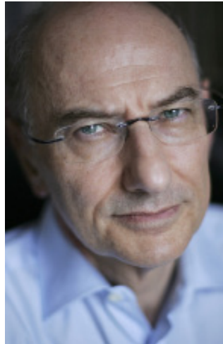
Hugues Dufourt