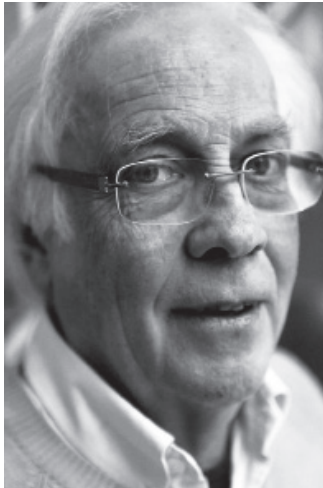
Gilbert Amy